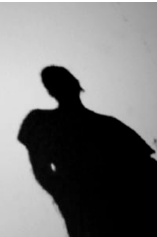
Schattenbild von Antoine Wagner-Pasquier und Gerhard Kramer

im Konservatorium der Stadt Luxemburg Luxemburg mit klassischem Schlagzeug- unterricht.