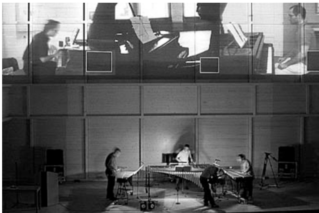
Aufführung von 'Liszttraum' am 15.10.2006 in Raiding

In den 'historischen' Räumen kommen historische Instrumente zum Einsatz, die Franz Liszt persönlich gespielt hat. Damit wird eine zusätzliche Dimension und Relation zu Franz Liszt hergestellt. Dabei bleiben werden die Zuspelungen der Klavier aus Raiding, Bayreuth und Luxemburg am Bahnhof Luxemburg gebündelt, wo auch die drei Schlagzeuger stehen und live dazuspielen.